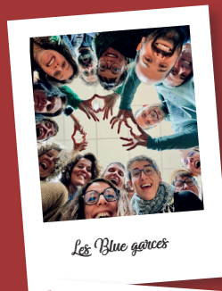
Les Blue girls

Infos et renseignements : actionculturelle@mairie-trelaze.fr