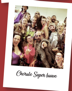
Chorale Super haune